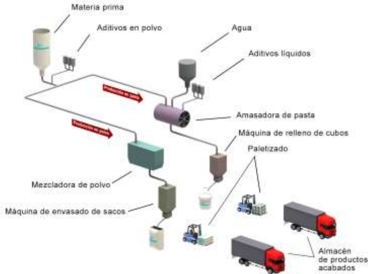
Diagrama de flujo del proceso de fabricación

Se reciben las materias primas en la planta de fabricación, donde se pesan y mezclan de acuerdo con la formulación. Una vez mezcladas, el producto se envasa en cubos de plástico para su almacenamiento en palets hasta la distribución del producto.