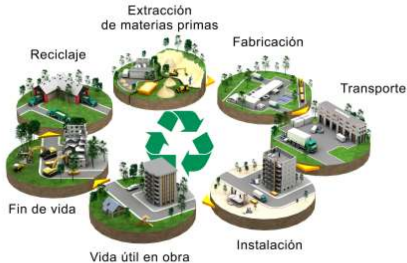
Diagrama de flujo del ciclo de vida